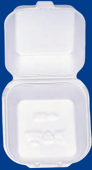
A Contenedor de alimentos Foam Container 5x5