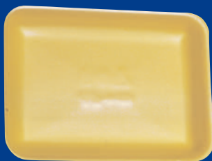
B Bandeja / Tray 2P