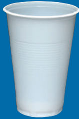
G Vaso/Cup 7 oz (210 C.C)