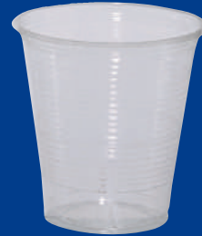
J Vaso/Cup 32 oz (760 C.C)