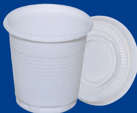
D Vaso/Cup 2 oz (60 C.C)