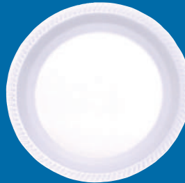
E Plato / Plate P-8