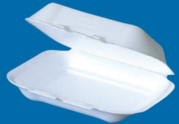
F Lonchera Suprema Supreme Lunchbox