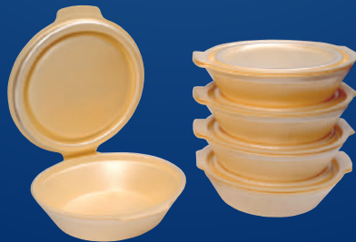
G Super Vianda Amarilla Super Yellow Lunch