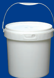
B Balde/bucket 4L