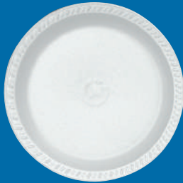
D Plato / Plate P-7