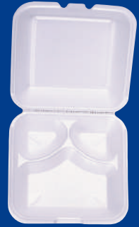
C Contenedor de alimentos compartido / Share Food Container 8 1/2 x 8 1/2