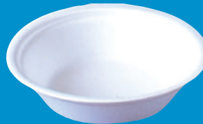
H Plato sopero Soup plate