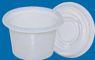
A Vaso/Cup 2/3 oz (20 C.C)