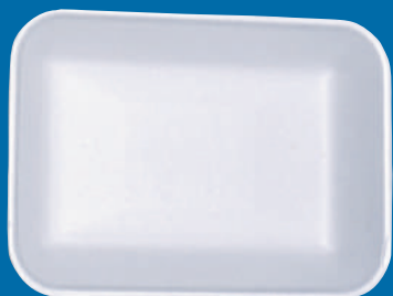
D Bandeja / Tray 4P