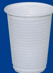
F Vaso/Cup 6 oz (180 C.C)