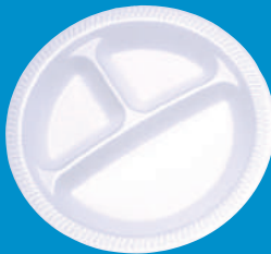
G Plato compartido Share Plate P-9 (3 Divisiones/Divisions)