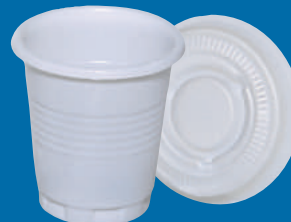
C Vaso/Cup 1 oz (30 C.C)