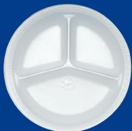
J Plato compartido Share Plate 10 ¼