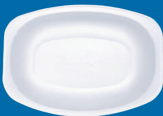
L Plato ovalado Oval plate 9x11