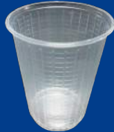
I Vaso Refresquero/ Refresher Cup 6 oz (180 C.C)