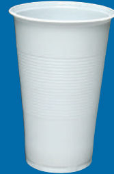
H Vaso/Cup 16 oz (480 C.C)