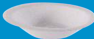
O Plato profundo 500cc /