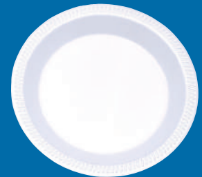
F Plato / Plate P-9