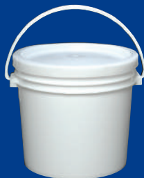
A Balde/bucket 1 Gl