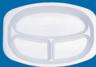
M Plato ovalado compartido Share oval plate 9x11