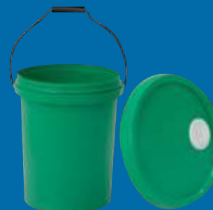
F Balde PP PP bucket 5gl