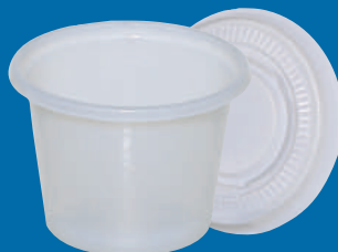
B Vaso/Cup 1 1/3 ozs (40 C.C)