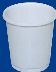
E Vaso/Cup 3 oz (90 C.C)