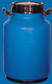
B Lechero/ Milk bucket 40 L