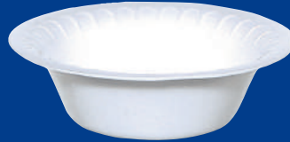
B Repostero Baking Plate 5 ozs