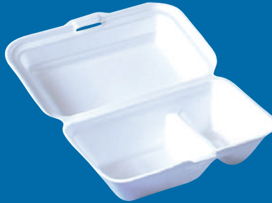
E Lonchera compartida Share food Lunchbox