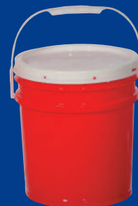
C Balde/bucket 10L