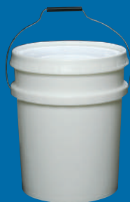
D Balde/bucket SBH 5gl