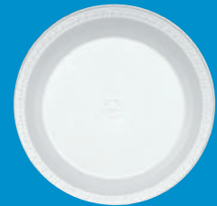
I Plato / Plate 10 1/4