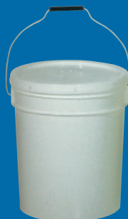
E Balde clásico Classic bucket 5gl