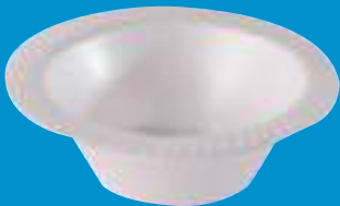
N Plato Cevichero / Plate