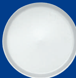
K Plato llano Flat Plate 12