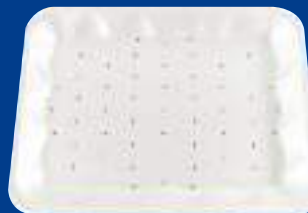
G Bandeja absorbente Blanca White Absorbent Tray ABSOTRAY 4P