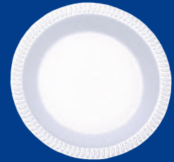
C Plato / Plate P-6