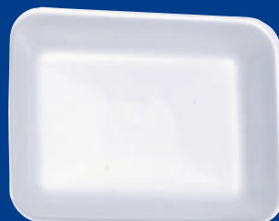
C Bandeja / Tray 3P