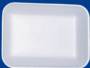
A Bandeja / Tray 2S