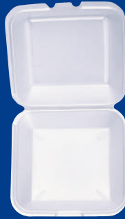
B Contenedor de alimentos Foam Container 8 1/2 x 8 1/2