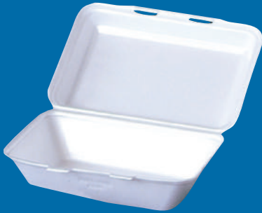
D Lonchera llana Plain lunchbox