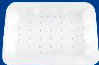
F Bandeja absorbente Blanca White Absorbent Tray ABSOTRAY 2P