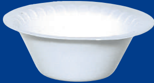
A Repostero Baking Plate 4 3/4